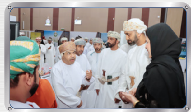
مشاركة في معرض التعليم المهني والتقني Vocational and Technical Education Exhibition