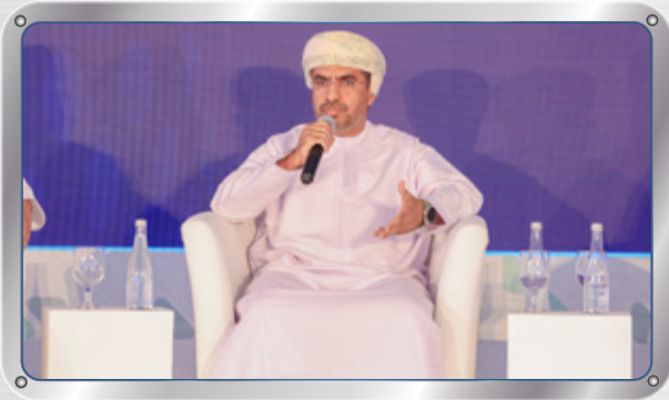
مشاركة في الجلسة النقاشية (الابتكار الصناعي في صحار: ما الفرص التي تنتظر مستثمري الغد؟) ضمن منتدى صحار للاستثمار Participation in the panel discussion "Industrial Innovation in Suhar: What Opportunities Await Tomorrow's Investors?" at Suhar Investment Forum