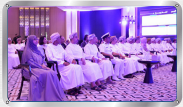
حضور منتدى قادة إيجاد ٢٠٢٦ Attending EJAAD Leadership Forum 2026