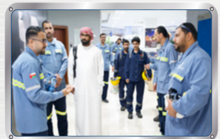
حملة التوعية الصحية خلال شهر رمضان Ramadan Health and Wellness Outreach Campaign