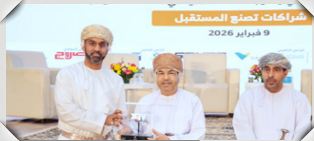
معرض التعليم المهني والتقني Vocational and Technical Education Exhibition