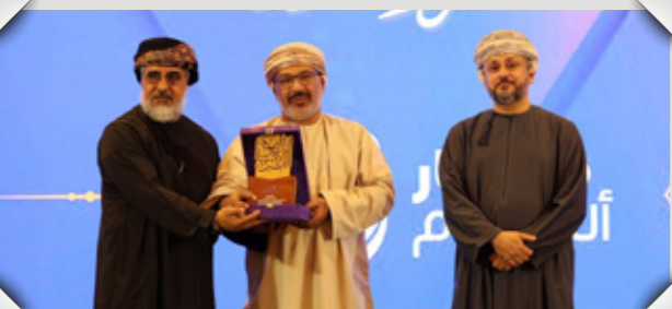
تكريم الشركة لدعمها مؤسسة الصحة الوقفية (أثر) SA Recognised for Supporting Health Endowment Foundation (Athar)