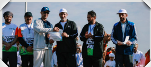
مسير صحر الدولي ٢٠٢٦ Sohar International Walk 2026