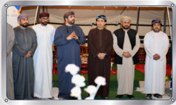
رعاية حفل تكريم اللجان المنظمة للملتقى الخليجي الأول للمكوفين Presiding over the Recognition Ceremony of the Organising Committees of the 1st GCC Forum for the Blind